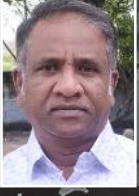
சிறுகதை வாசுதேவன் அருணாசலம்